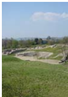
Théâtre antique d'Alba-la-romaine