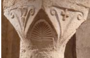
Chapiteau dans la crypte de l'abbatiale de Cruas.

Les ruelles de Rochemaure et son château