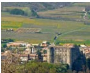
Le village médiéval d'Alba-la-romaine