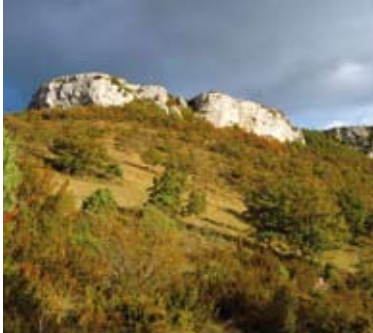
Massif de la dent de Rez