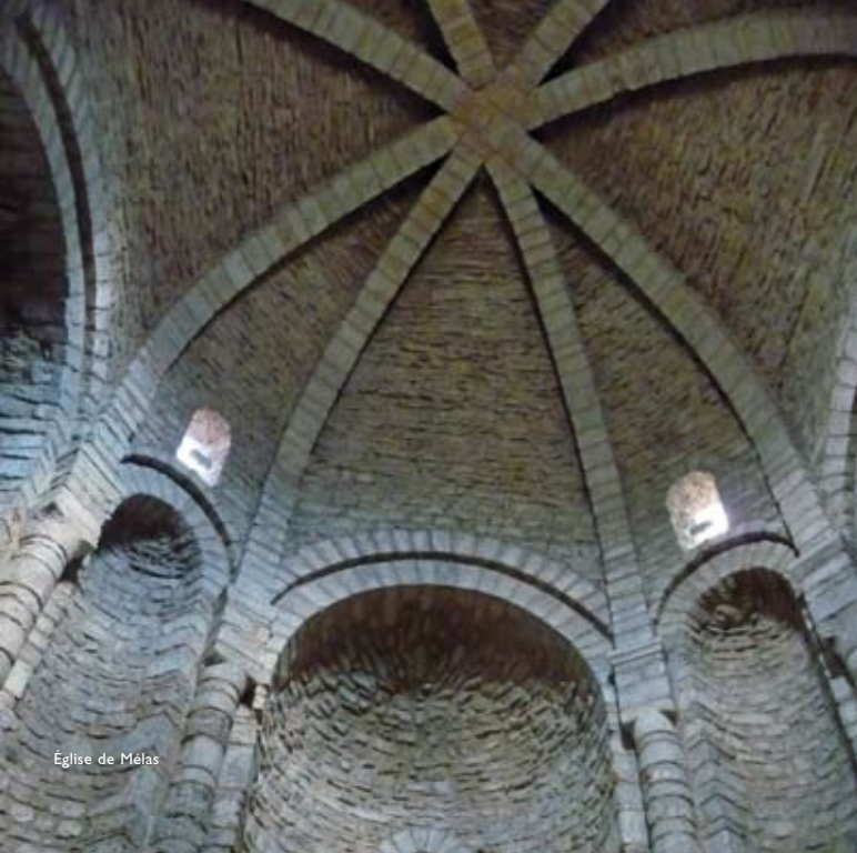
Église de Mélas