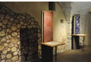
Espace culturel Olivier de Serres Domaine du Pradel - Mirabel

→ salle de la maquette (rond-point de l'usine Lafarge).