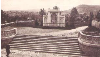
Monument aux morts de Villeneuve de Berg