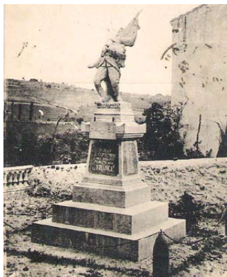
Monument aux morts, Saint-Jean le Centenier, vers 1920

Durée : 1h30 - gratuit → Théâtre municipal